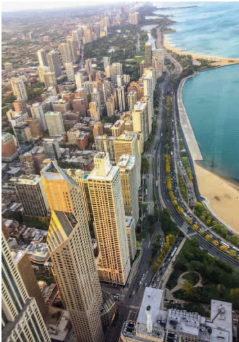
EXPO Chicago 2018, Foto: Jeff Shear, Courtesy: EXPO Chicago

Land Art Eisenberg Das Kunstprojekt am Dreiländereck nimmt immer mehr Gestalt an von Peter Funken 320