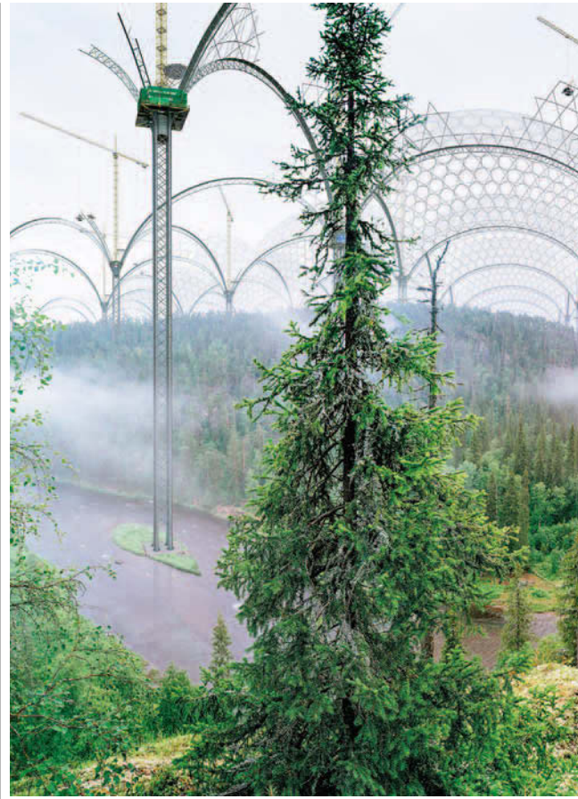
Ilkka Halso, Kitka-river , 2005, aus der Serie Museum of Nature , Triptychon, Pigmentdruck, Diasec, 183 × 300 cm, resp. 91 × 150 cm, © Ilkka Halso

Die Natur steckt in der Krise. Der ökologische Fußabdruck des Menschen ist größer als die Natur verkraften kann. Und neben der brachialen Zerstörung natürlicher Lebensräume hat die Technisierung in alle Bereiche der Umwelt Einzug gehalten. Im gleichen Zuge stimmen gegenwärtige Theoriediskurse den Abgesang auf die Natur an, indem sie gängige Natur/Kultur-Konzepte aufkündigen und den Begriff des Natürlichen verabschieden. Die Kunst reagiert auf die Vorstellung einer vom Menschen gemachten, einer künstlichen Natur, die seit rund zwei Jahrzehnten unter dem Schlagwort des Anthropozän die öffentliche Diskussion beherrscht. Künstlerinnen und Künstler positionieren sich dabei zwischen Kunstnatur und Naturkunst, indem sie einerseits synthetische Prozesse der Erzeugung von Natur anwenden und andererseits Natur nach wie vor als Motiv- und Ideengeberin nutzen. Die Natur ist tot. Es lebe die Natur. Ihre Konjunktur in der Kunst zeigt: Sie ist widerständig, fordert zu immer neuen Auseinandersetzungen und bringt dabei mehr als Naturuntergangs- und Naturrettungskunst hervor. Der Themenband liefert eine Bestandsaufnahme ästhetisch, technologisch und ökologisch motivierter künstlerischer Positionen.