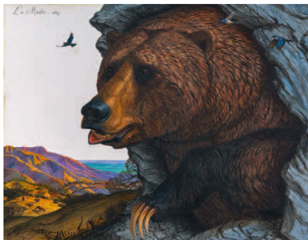
Walton Ford, La Madre , 2017, Wasserfarbe, Gouache, Tinte/Papier, auf Aluminiumplatte aufgezogen, 274,3 x 365,8 cm

Hartmut Böhme Tote Natur? STEIN UND PETREFAKT, WÜSTE UND ARKTIS ALS DIMENSIONEN DER KUNST IM ANTHROPOZÄN 96