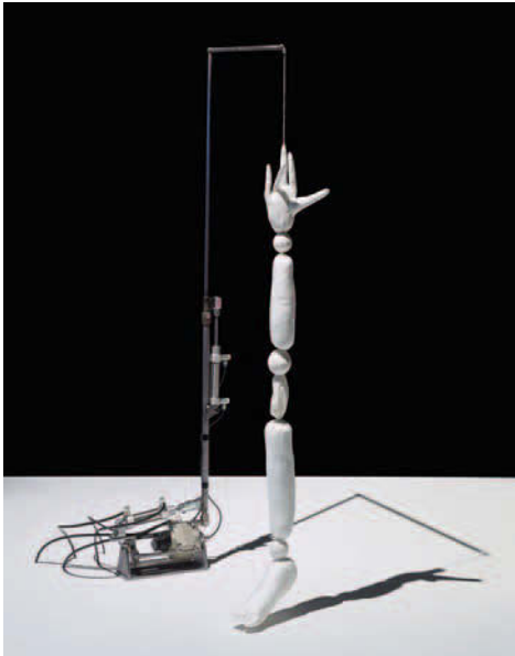
Yves Netzhammer, Biografische Versprecher , Installationsansicht. Luftdruckanimierte Skulptur o. T., 2018, © Netzhammer u. Museum zu Allerheiligen Schaffhausen

Manfred Erjautz: Space of Moments Saalfelden / Österreich von Matthias Reichelt 279