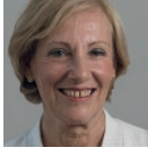
Homi K. Bhabha